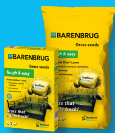
TOUGH & EASY Resilient Blue Lawn