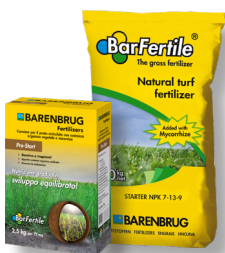
BarFertile Pro-Start/Starter Concime organo-minerale per semina (ricco in P)