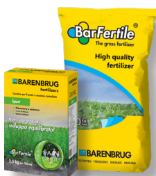
BarFertile Sport Concime minerale con N a rilascio controllato