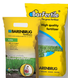
BarFertile ACTIVE Concime minerale, bilanciato per ogni stagione