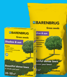
SHADOW & SUN Shadow