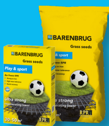
PLAY & SPORT Bar Power RPR