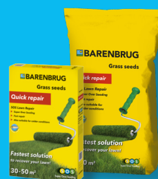
QUICK REPAIR SOS Lawn Repair