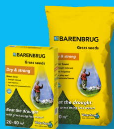
DRY & STRONG Water Saver